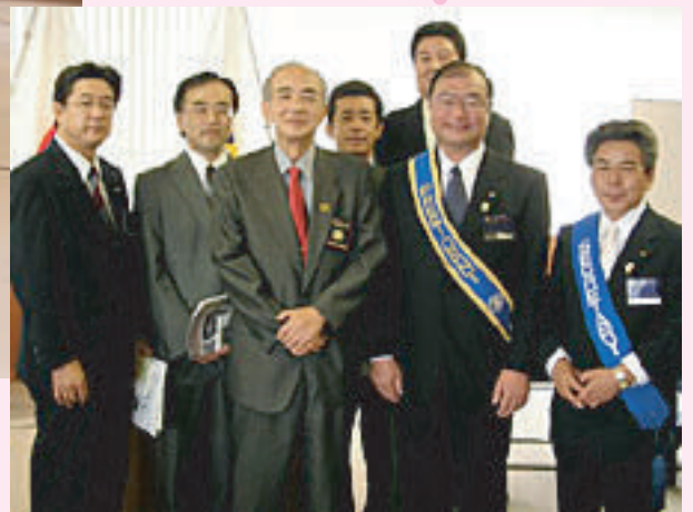
高山ガバナーと新入会員4名、会長、幹事