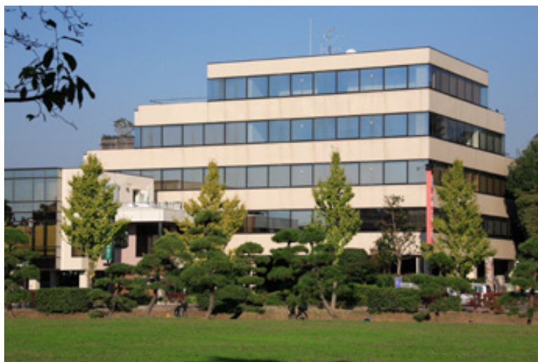
アドバンテスト行田 クラブハウス 撮影日 2007.11.7