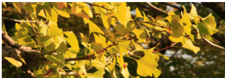
行田市水城公園 紅葉風景 撮影日 2007.11.7