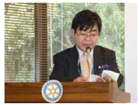
ニコニコ報告 反町清委員長