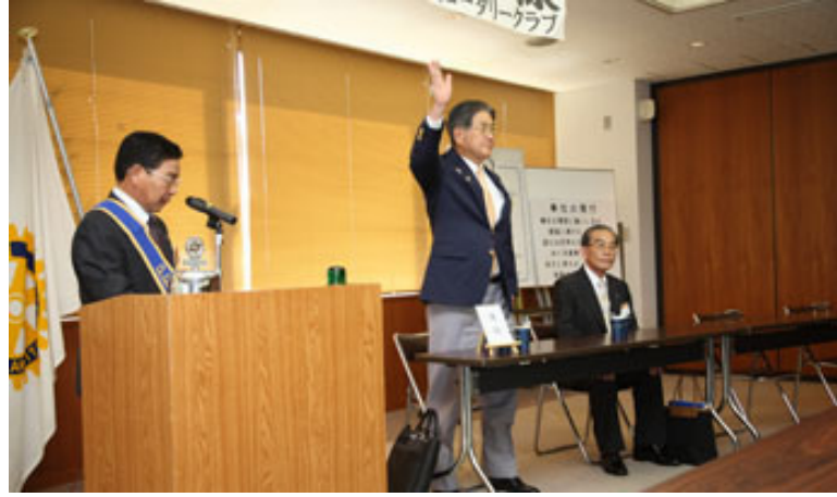
ビジター紹介風景