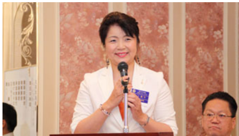
～ニコニコ報告 次のページに記載～