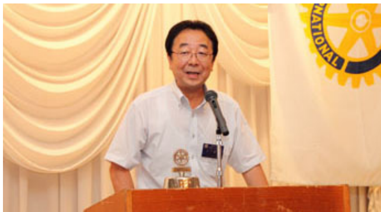
～本日の卓話 右のページ上へ続く～

9月10日と9月11日に、行田市に於いて関東B-1グランプリが 開催されます。行田ロータリークラブでは、会場にてボランティア 活動を行う事になりました。古沢委員長より、当日の活動内容 など詳細に発表をして頂きました。