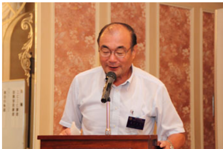
～ニコニコ報告 次のページに記載～