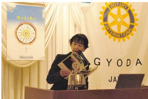
ロータリーの友 関副委員長