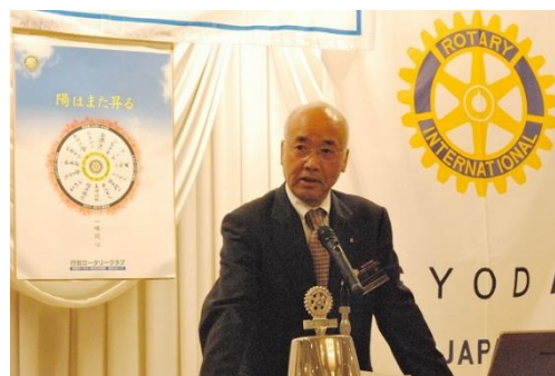
小沢会長エレクト挨拶

いよいよ、伝統ある行田ロータリークラブの会長という事で大変プレッシャーを感じています。出来たら誰か代わってくれたらいいのにと今でも思っています。