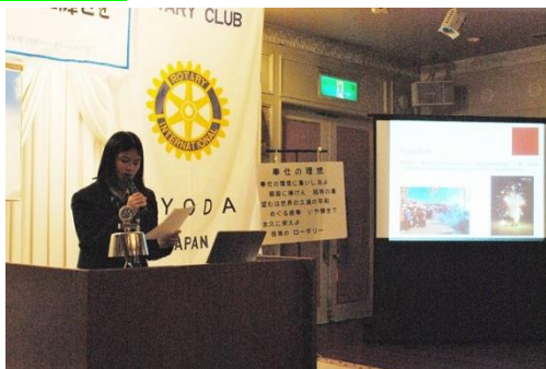
アリスさんが、中国の正月について発表しました。