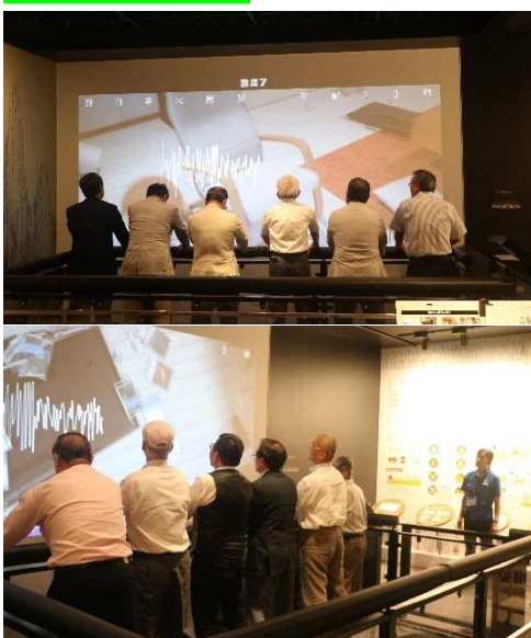
上の写真は 阪神淡路大震災、東日本大震災の 2 つのパターン体験することが出来、揺れ方は大きく異なります。