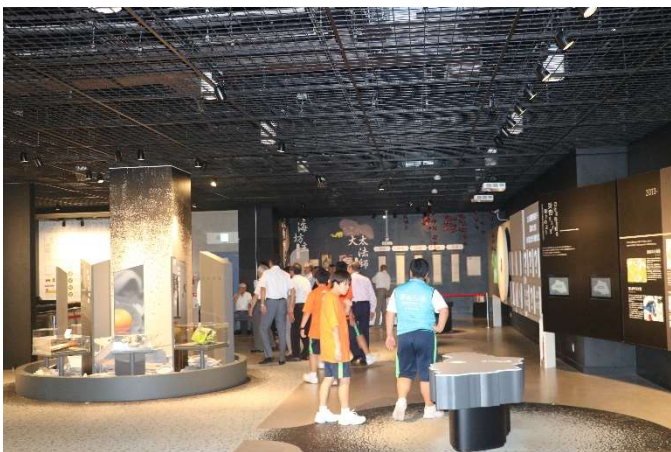
(平成 30 年 3 月に改修工事を終え施設内はきれい)