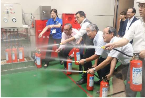
消火器は数十秒しか噴射しません。 しっかり炎を狙いましょう！