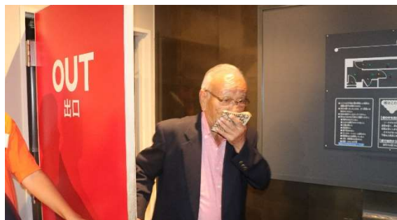
煙の充満する室内に入り、口にハンカチをあて、腰をかがめて暗闇の部屋で出口を探します。非常口は基本的に外側に開くため、押して開く扉を探しましょう！