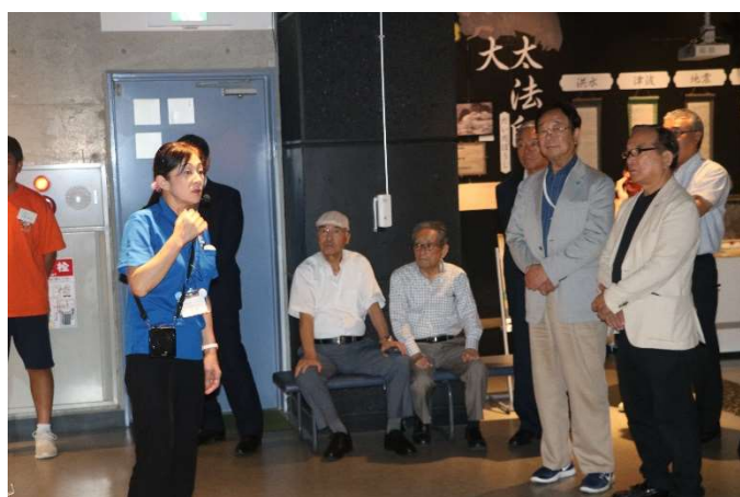
体験学習前に説明を受ける行田 RC 会員