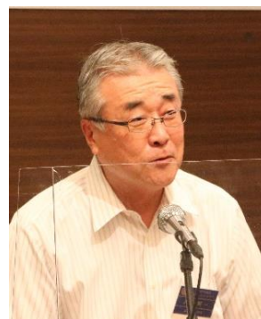
大谷会員選考・増強委員長