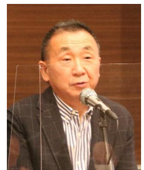
武笠未来創造委員長