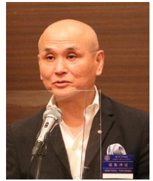
福島未来・創造部門長