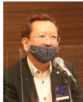
小松デジタル委員長