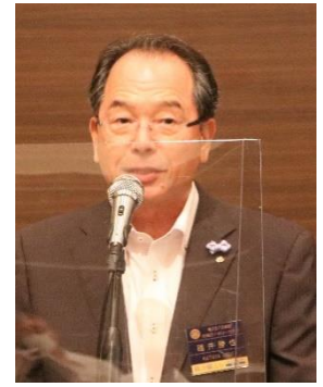
碓井青少年社会活動部門長