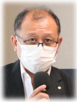
出席・ニコニコ小池委員