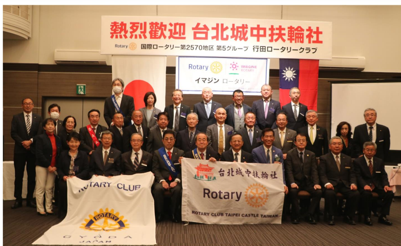
台湾城中 RC Lawyer 会長・Clayton パスト会長 来訪記念