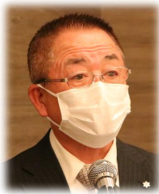
出席・ニコニコ 松本委員長