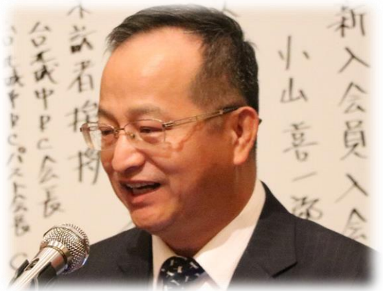
Lawyer 台湾城中 RC 会長