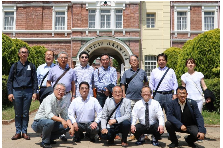
牛久シャトー前にて記念撮影