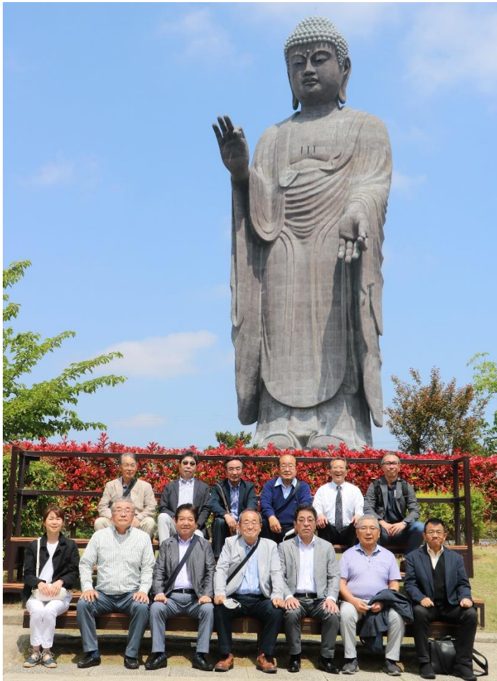
牛久大仏前にて記念撮影