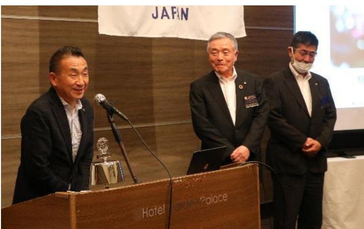
明大マンドリンクラブ定期演奏会のPR