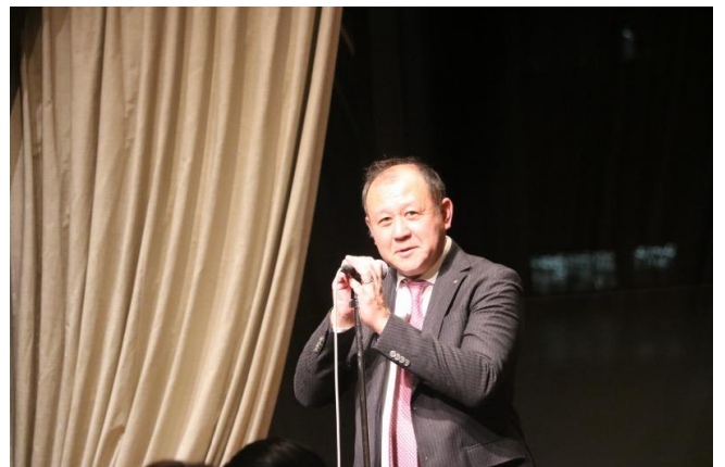
司会 宮内会員、大石会員