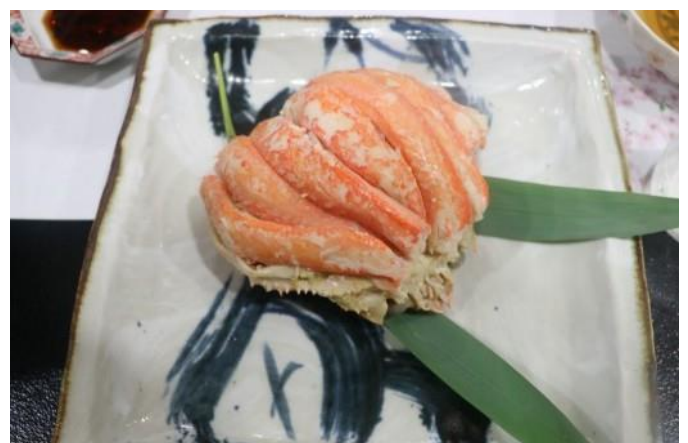
とっても美味しい、かにでした。