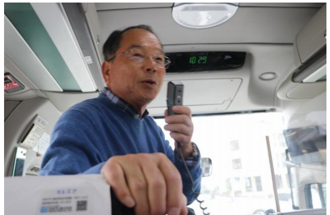
曹洞宗大本山 永平寺